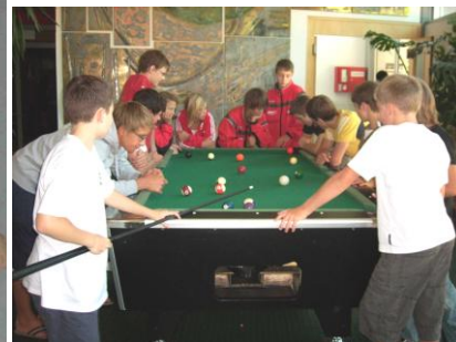
Bilder vom Trainingscamp Tschagguns

Anreise: Wer mit der Bahn anreist, muss in Bludenz in die Montafonerbahn Bludenz-Schruns umsteigen. Mit der Montafonerbahn fährt ihr bis zum Bahnhof Tschagguns . Dort werdet ihr um ca. 15 und 17 Uhr mit dem Sportschulbus abgeholt. Kommt jemand zu einem anderen Zeitpunkt dort an, so kann er sich unter der Tel.: 05556/76176-0 in der Sportschule melden.